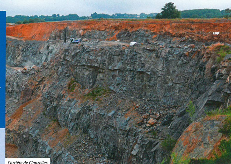
Carrière de Clauzelles

1 Remonter de quelques mètres vers le nord et prendre à droite le chemin goudronné en dessous d'un terrain de jeux public puis longer l'étang sur environ 200 mètres. Continuer jusqu'à la carrière, la contourner par la droite, jusqu'à Girman Bas . Prendre à gauche sur la route goudronnée sur 150 mètres puis la quitter avant le virage à droite en continuant tout droit sur un chemin de terre. Poursuivre jusqu'à hauteur d'un banc public, et continuer sur ce chemin longeant la route sur 100 mètres puis prendre à gauche.